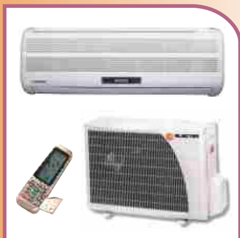
Unidad split para instalación en pared New Generation. Nuevo display inteligente.

Control remoto inalámbrico con funciones inteligentes. "I feel" que transfiere el punto de medición de la temperatura ambiente al lugar donde el control remoto esta ubicado (junto al usuario). "Sleep" regula la temperatura durante la noche.